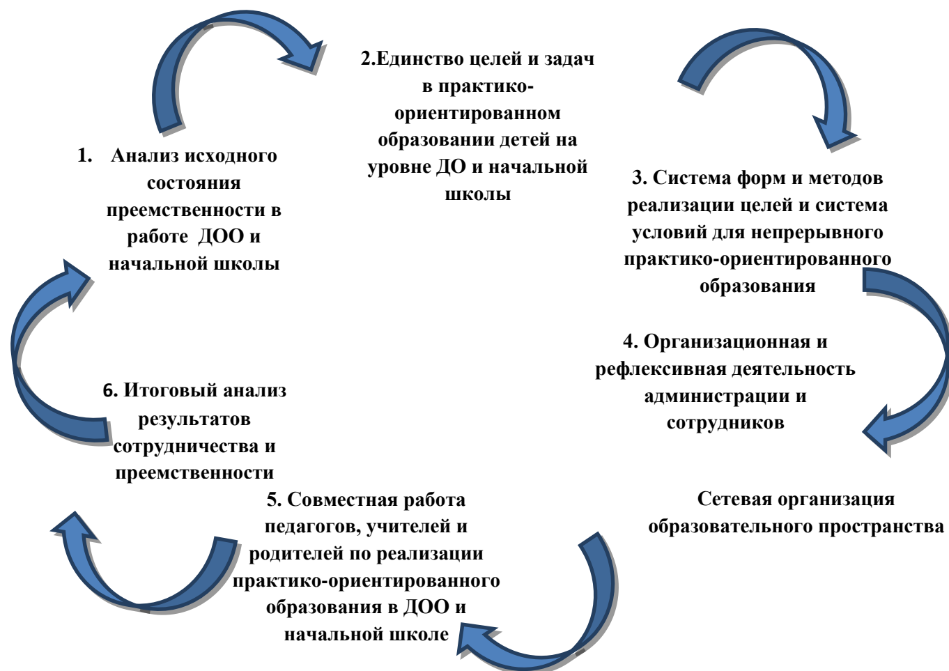
Схема № 2. Модель непрерывного образования в рамках реализации практико – ориентированного образования на уровне дошкольной организации и школы

Анализ существующих подходов к преемственности дошкольного и начального школьного образования в рамках реализации практико – ориентированного образования позволяет разработать модель преемственности практико – ориентированного образования дошкольного и начального уровней образования я.